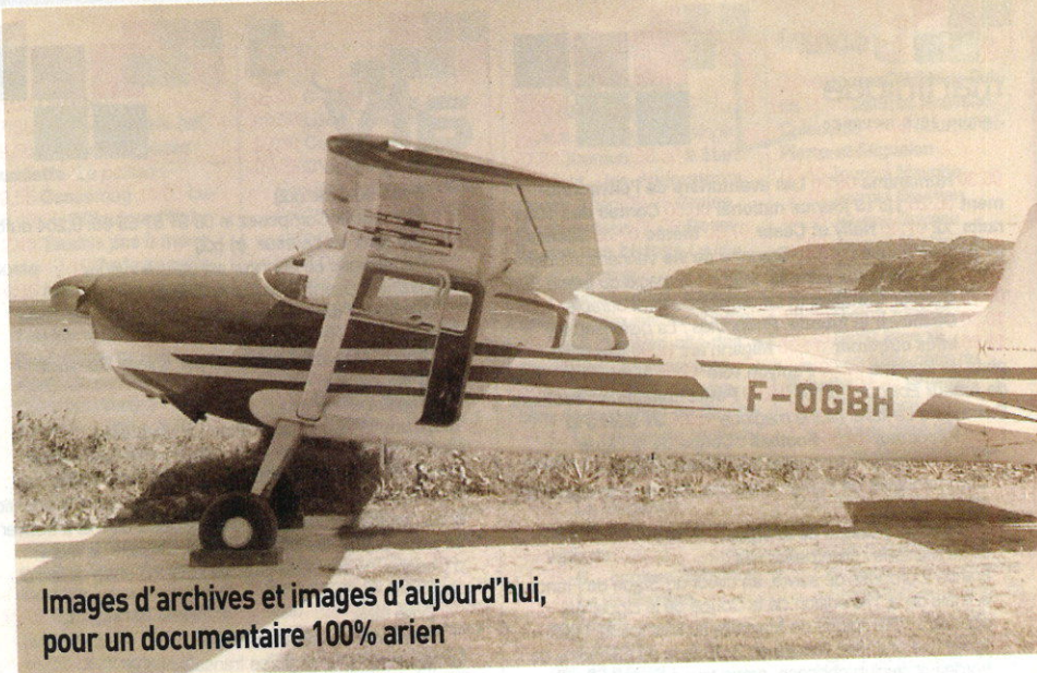
Images d'archives et images d'aujourd'hui, pour un documentaire 100% arien

J'ai rencontré de nombreuses personnes à l'occasion de ces tournages. Toutes avaient comme point commun de connaître ou d'avoir vécu une partie de l'histoire de l'aviation dans la région. J'ai rencontré beaucoup d'anciens, mais aussi beaucoup de pilotes plus jeunes, qui restent d'une certaine manière des pionniers de l'aviation car ils utilisent l'avion aujourd'hui de différentes